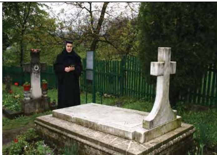
Mormântul generalului locotenent Paul Teodorescu

În decorul mirific al sfântului lăcaș, participanții la pelerinaj au servit o masă creștinească. Mijlocul de transport a fost pus la dispoziție de Statul Major al Forțelor Aeriene, căruia îi adresăm mulțumirile celor ce nu-l uită pe fostul ministru.